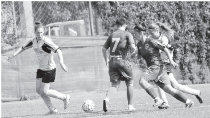
A Vasas Femina fiúcsapata lesz az ASA ellenfele a Románia-kupa nyolcaddöntőjében. Képen a székelyudvarhelyiek élvonalban szereplő együttese elleni mérkőzésen (11-0) készült, 2016. szeptember 10-én.