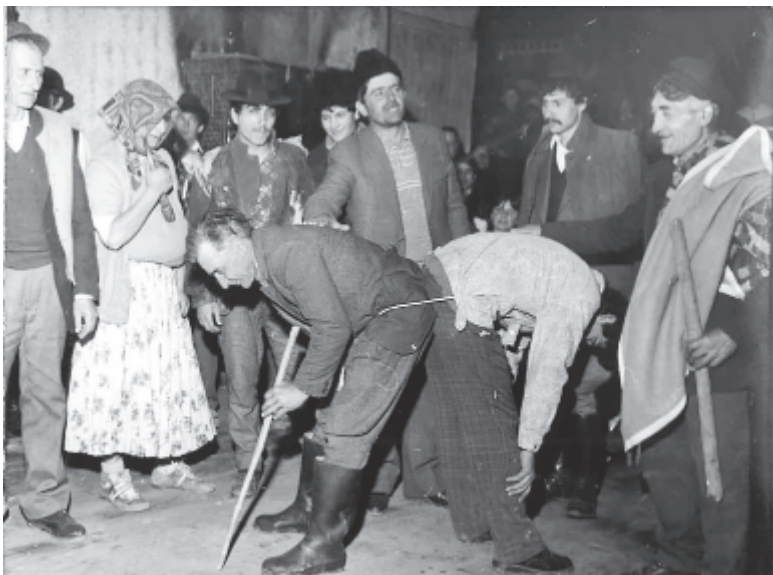
Készülnek a lovas játékra Teremiújfaluban (1990)

A lovat kétféleképpen alakították, de mindig együtt a lovat és a lovasat. A nyugati, mezőségi falvakban a fazékfejes lóalakítás ismeretes. Ezt a lovat pokróccal letakart, derékből meghajolt két játékos alakította, az első egy botra húzott cserépfazakat tartott a feje fölött. A lovas, a gazda „lóra” ült, és így mentek be a fonóba. Együtt járt velük néhány kecske, akik szerették volna a lovat megvásárolni. A komikus vásári jelenet során a gazda agyonüti az állatot: botjával szétveri a fazakat. A ló meghal, elterül, majd kis idő múlva a játékosok kiszaladnak a fonóból (Mezőpanit, Teremiújfalú). A Nyárad menti és a Kis-Küküllő vidéki falvakban a fafafejű, favázás lóalakítás ismert. A fából faragott lófejet a játékos a melléhez, farát a hátához erősítette. A lovat elől-hátul leterítették, a lovas saját lábán állt, gyepelt fogott a kezében, úgy nézett ki, mintha lovon ülne. A falovas a fonóban szépen viselkedett: körbejárt, ugrándozott, a fonóbeliek énekére táncolt (Harasztkerék, Szentgerice), csatlakozhatott a betyárokhoz is (Szentháromság). A fafejű ló és lovas a farsang végi dramatikus szokásokban és a farsangon kívüli szokásjátékokban is gyakran megjelent. Kibédén napjainkban is jól meghatározott szerepe van a szépek között a piros és a fehér lovasnak.