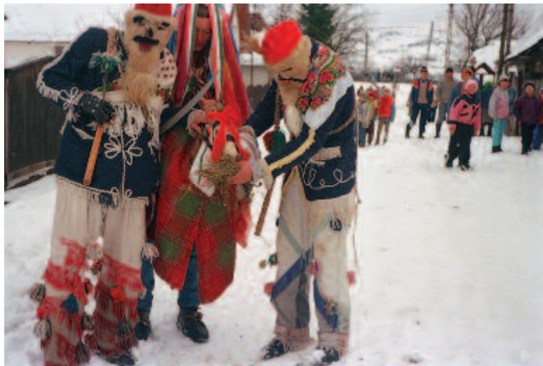
Két bőrálarcos ostoros között a fehér falovas Kibédén (2000)

Régióink legtöbb vidékén ezt a két farsangi szerepkört különböztették meg. Szépek: a szépen, különösen díszesen öltözöttek, csipke vagy színes szalagos álarcúak, akik szépen viselkednek , énekelnek, táncolnak, például a betyárok, huszárok, úrfi és kisasszony, lakodalmások, szép cigányok, az állatmaszkok közül a ló vagy lovas stb. Együttessen a farsangi életszemlélet harmónikus oldalának kifejezői. A csúfok az ijesztő, félelmet keltő vagy nevetést kiváltó figurák. Régi, rongyos ruhákat vettek magukra, rendszerint kifordítva, arcukat ijesztővé vagy groteszkké változtatták, bekormozták, lisztezték, szilvaízes tollúval szórták be, bőrálarcot tettek stb. Csúfnak tartották az állatmaszkos játékok többségét, a halált megjelenítését stb. A játék típusát is meghatározta, hogy valakit szép fársángnak vagy csúfnak öltöztettek, és némely közösségben azt is szabályozták, hogy