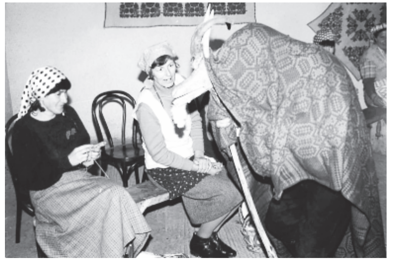
A szabédi kecske „beszélget” a fonóbeli asszonyokkal (1992)

Nem hagyhatjuk figyelmen kívül a fonóbeli maszkos játékok szociálpszichológiai vetületét sem. A maszkurának öltözött legény számára a maszk titkossága arra is jó volt, hogy megértse a fonóbeli szituáció jeleit: melyik legény melyik leány mellett ül, kik járnak a fonóba, milyen esélyei vannak az udvarlásra stb. A maszkos játékban a kommunikáció és viselkedés olyan formáira is sor kerülhetett (érintés, ölelés, csipkedés, tánc), amelyekre maszk nélkül ritkán vagy egyáltalán. Figyelemre méltónak tartom a fonóbeli emlékeiket felidéző beszélgetőtársaimnak azt a tapasztalatát, hogy gyakran azok a legények öltöztek maszkurának, akiknek nem volt párjuk, párt kerestek. A fonóbeli maszkos játékokat a párválasztó népi stratégia egyik hagyományos és jól bevált elemének, módszerének is tekinthetjük. A