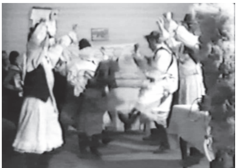
A falovas és a betyárok tánca Szentháromságon (1993, filmkocka)

A maszkos alakok rövidebb-hosszabb jelenete után vagy akár közben is táncra kérhették a fonóbeli leányokat és asszonyokat, énekeltek nekik. A jelenet végén a maszkosok némely helyen bemutatkozhattak, levehették a csipkét az arcukról, megkínálták őket itallal. Másutt, ha túl durvára sikerült a játék (a leányok csipkedése, fogdosása) guzsalyokkal kiverték, kispéruzták őket a fonóból. Ez attól