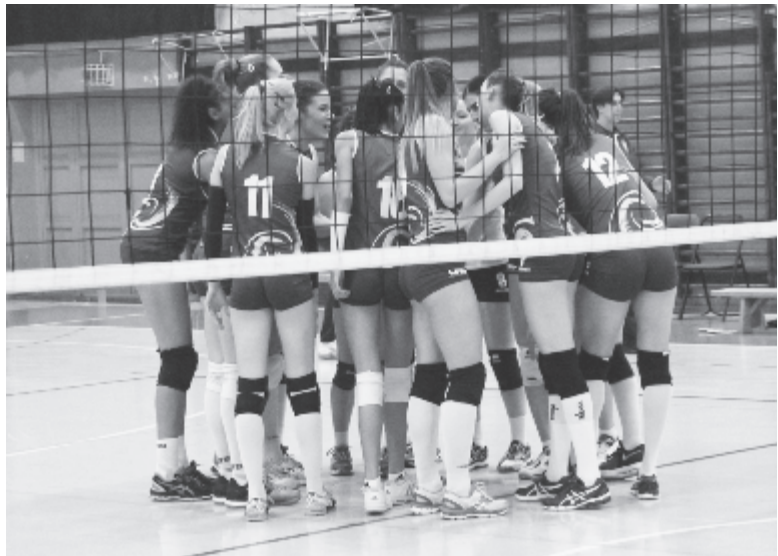
A Medicina ezzel ismét versenyben van a hat közé jutásért, bár a bajnokságban eddig történetek alapján inkább nem jósolgatnánk.