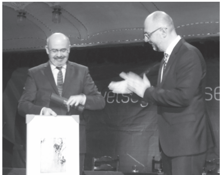
Markó Bélának megköszönték eddigi tevékenységét