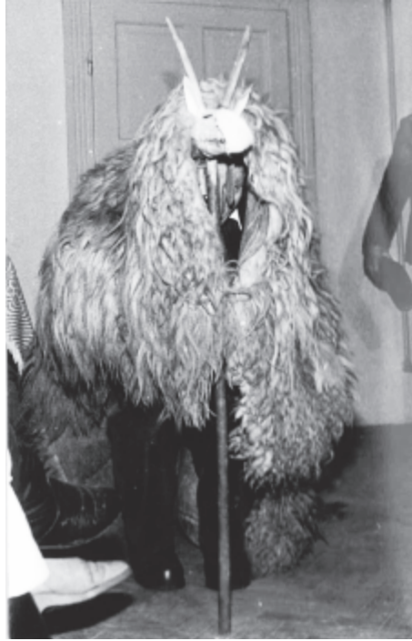
Indulásra készen a paniti kecske (1993)

A fonóbeli játékoknál még szorosabban kapcsolódik a fonóhoz mint szokásalkalomhoz és helyszínhez a