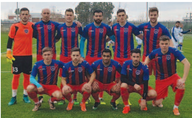
A PFC Montana elleni mérkőzés alkalmával készült csapatkép